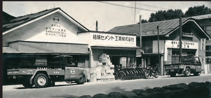
昭和34年 結城セメント工業株式会社 創立