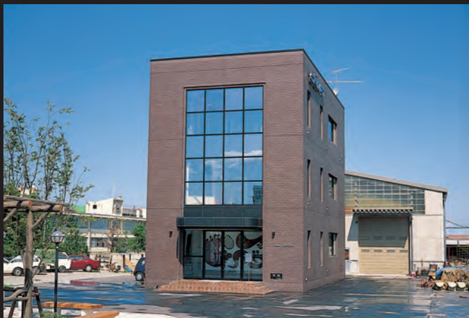
平成4年 株式会社クラフト日本社ビル落成