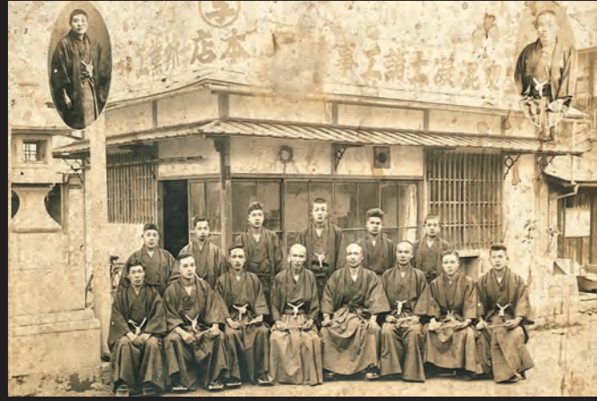
大正3年 ⑤ コンクリート工業所 創業