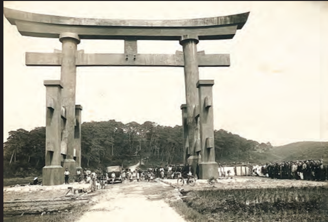
昭和4年 羽黒山大鳥居 建設