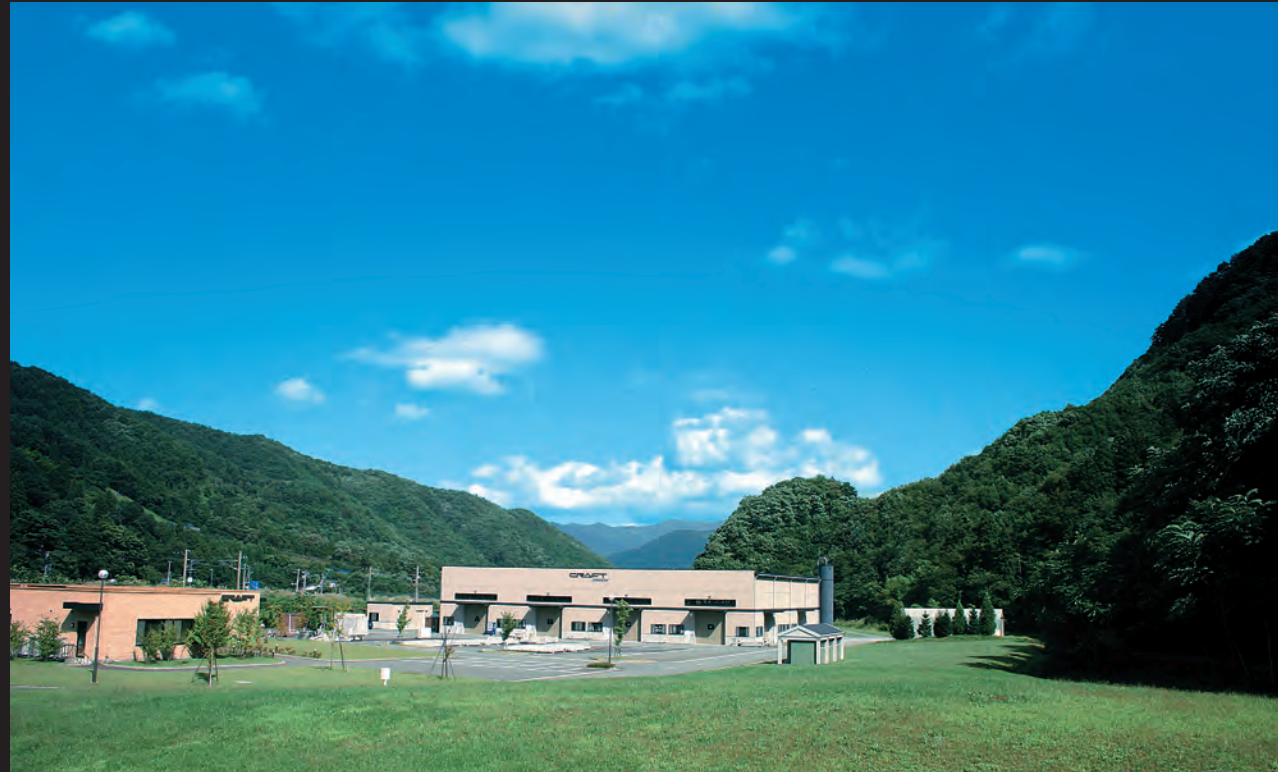
株式会社クラフト本社（山形県上山市）